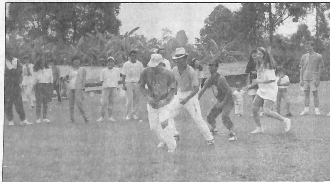
Algunos miembros de la comunidad seminarista en actividades de integración.

Administración de la Escuela Dominical. Enfoque sobre el comportamiento de las fuerzas vivas de la iglesia, desarrollo de programas de enseñanza y organización de