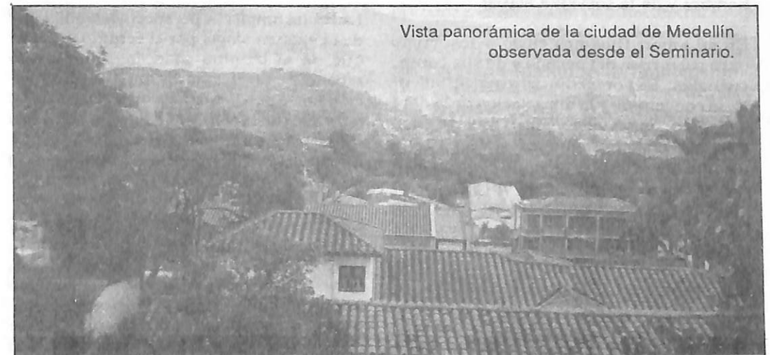
Vista panorámica de la ciudad de Medellín observada desde el Seminario.