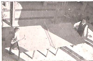
Momentos de diversión