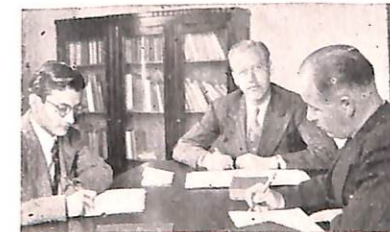
La tarea estudiantil