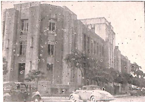
Izquierda: El Centro de Medellín.

El nuevo edificio que ahora está construyéndose, estará provisto de amplios dormitorios, salones de clase, y comedores, además de biblioteca y capilla. Los terrenos del Seminario están ubicados en uno de los más bellos barrios de la ciudad, con vista al hermoso valle de Medellín, y con facilidades de acceso desde el centro por medio de un servicio regular de buses.