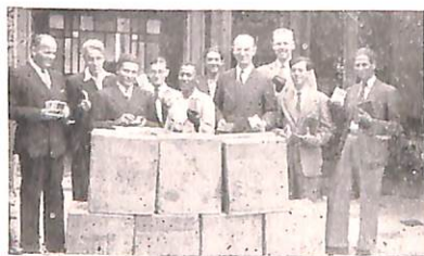
Listos para sembrar La Palabra

Cuando algún estudiante desee ocuparse en la obra misionera durante el período de sus vacaciones debe ponerse en contacto directo con el Director de la Obra de Evangelización, quien lo ocupará si ello es posible. No puede darse una garantía absoluta sobre el particular, dependiendo en gran parte de las capacidades y consagración del mismo estudiante. Así mismo, se espera que el estudiante durante el período de sus vacaciones se haga a los fondos necesarios para sufragar sus gastos personales durante el tiempo de sus estudios.